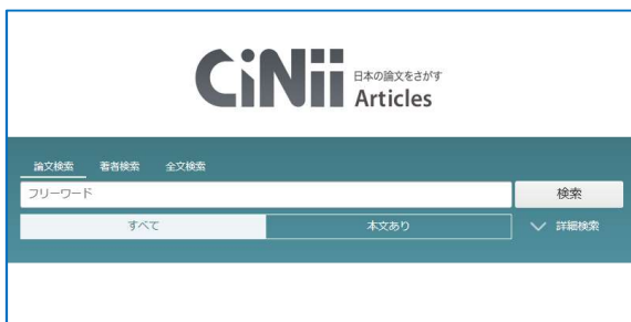
国内の論文を探せる「CiNii（サイニー）Articles」