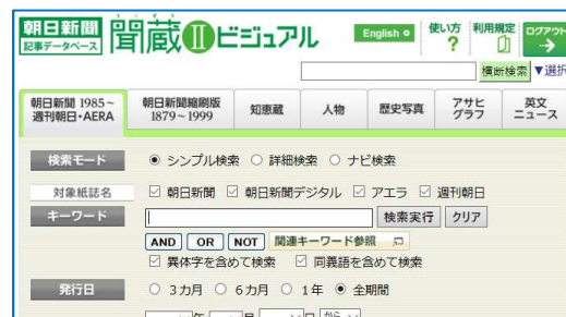
キーワードで記事を検索し、読むことができる朝日新聞記事DB「聞蔵」